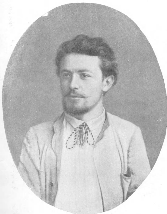
А. П. ЧЕХОВ. 1888 г.