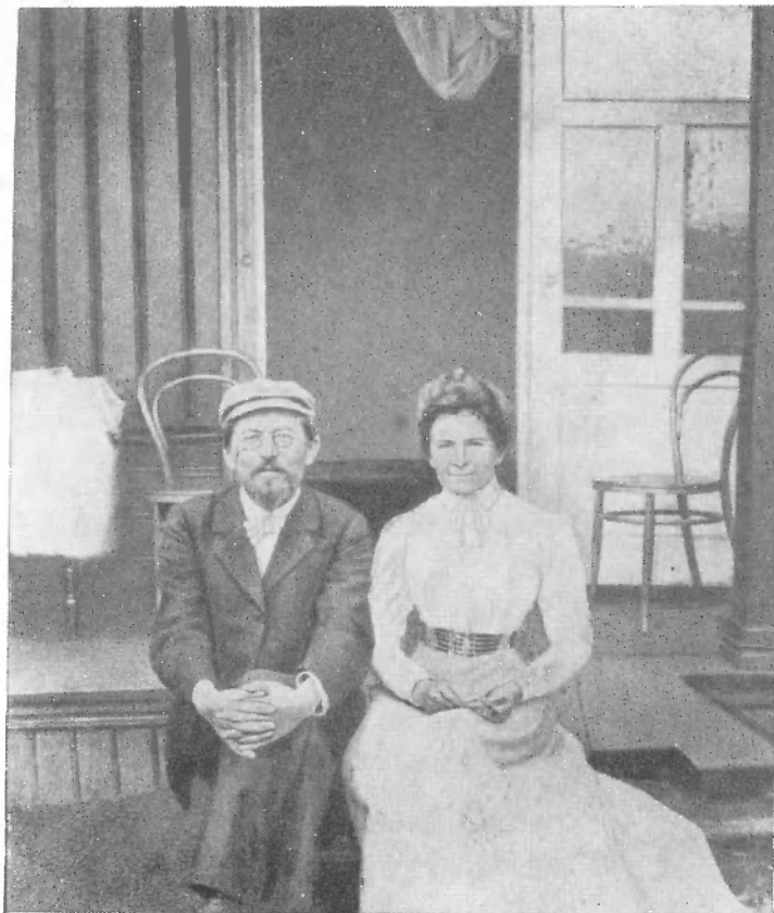
А. П. Чехов и О. Л. Книппер-Чехова в санатории Аксеново, Уфимской губ. 1901 г.