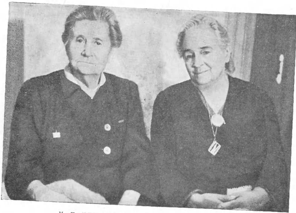
М. П. ЧЕХОВА И О. Л. КНИППЕР-ЧЕХОВА.