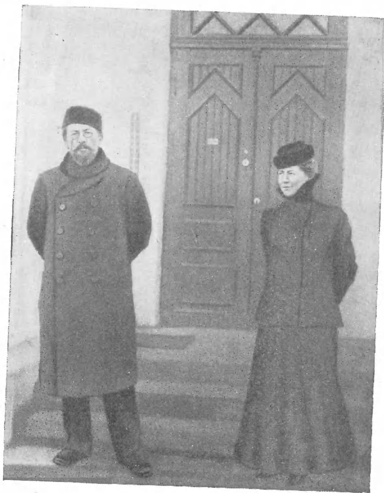
А. П. и М. П. Чеховы у парадного входа ялтинского дома. 1902 г.