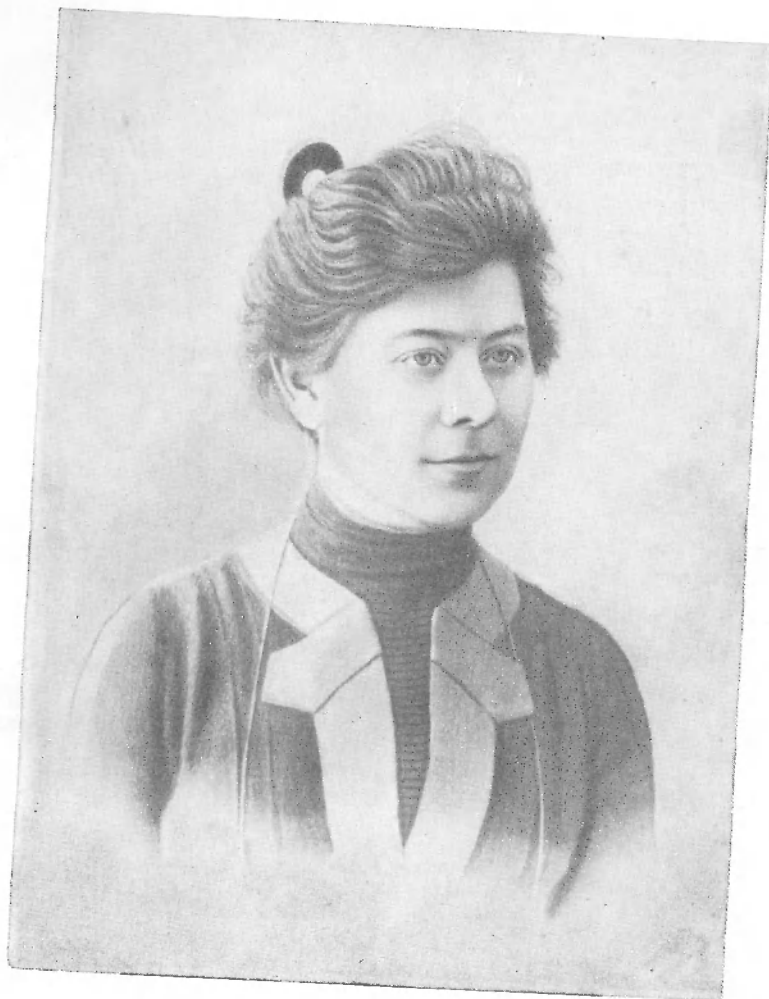
М. П. ЧЕХОВА. 1896 г.