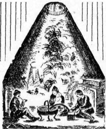
НА РИСУНКЕ: внутренний вид калмыцкой кибитки. Рис. 3. Глотовой.

ляться на военную службу в Оренбург под командой своих командиров из знати и иметь при себе полностью вооружение и снаряжение, вплоть до запасного коня.